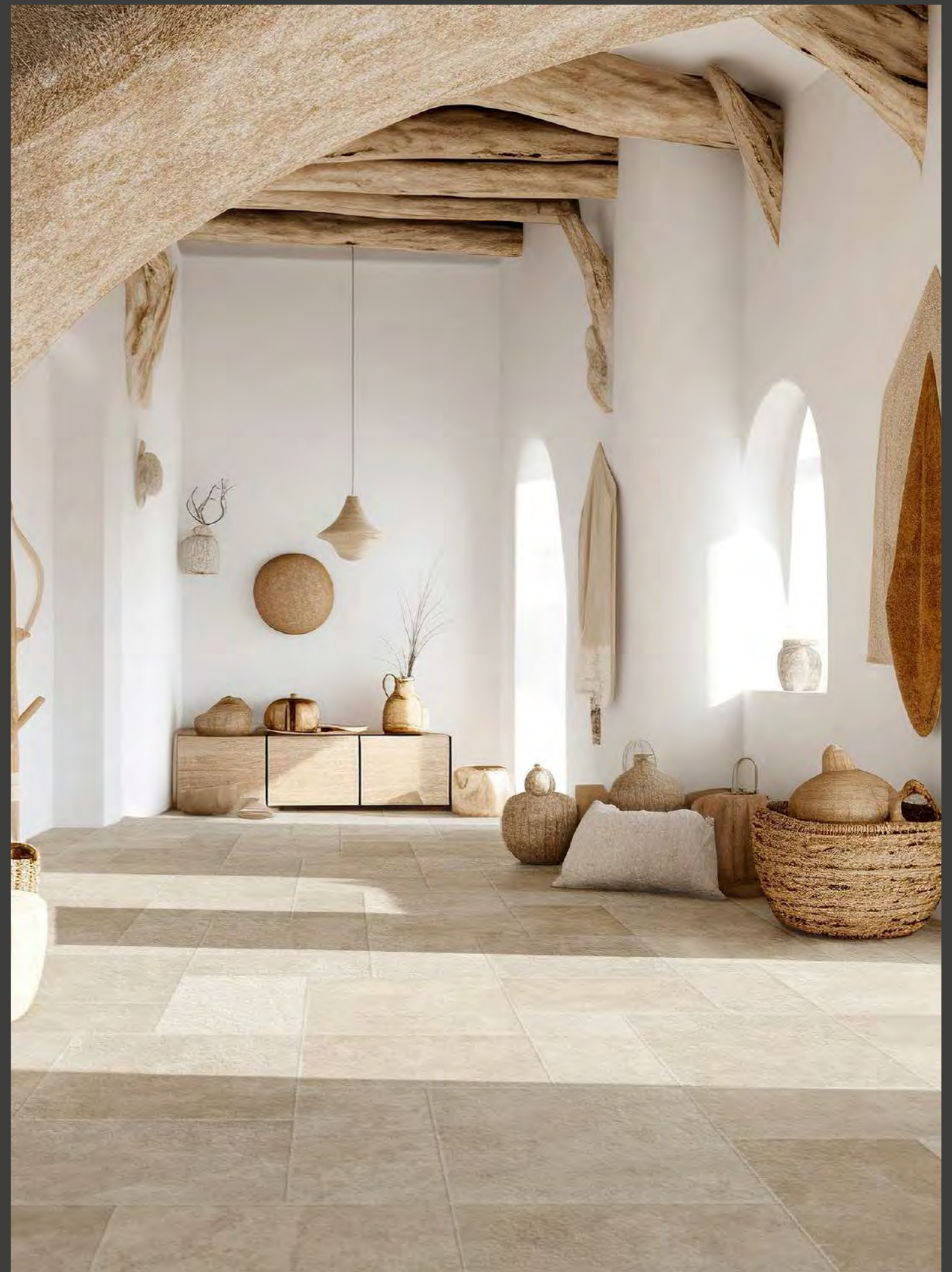
Levante Naturale 30x60-40x60-60x60