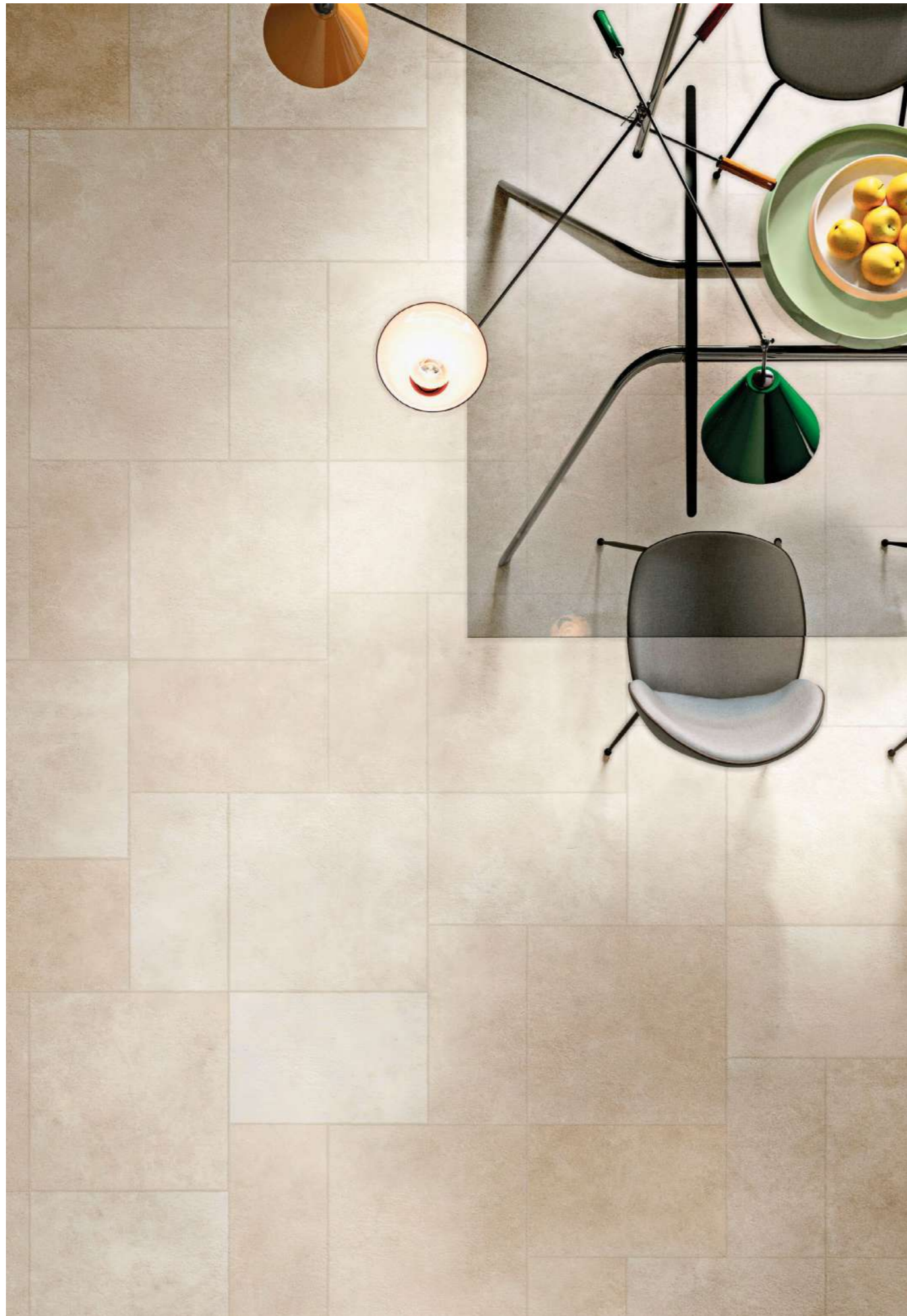
Levante Naturale 30x60-40x60-60x60