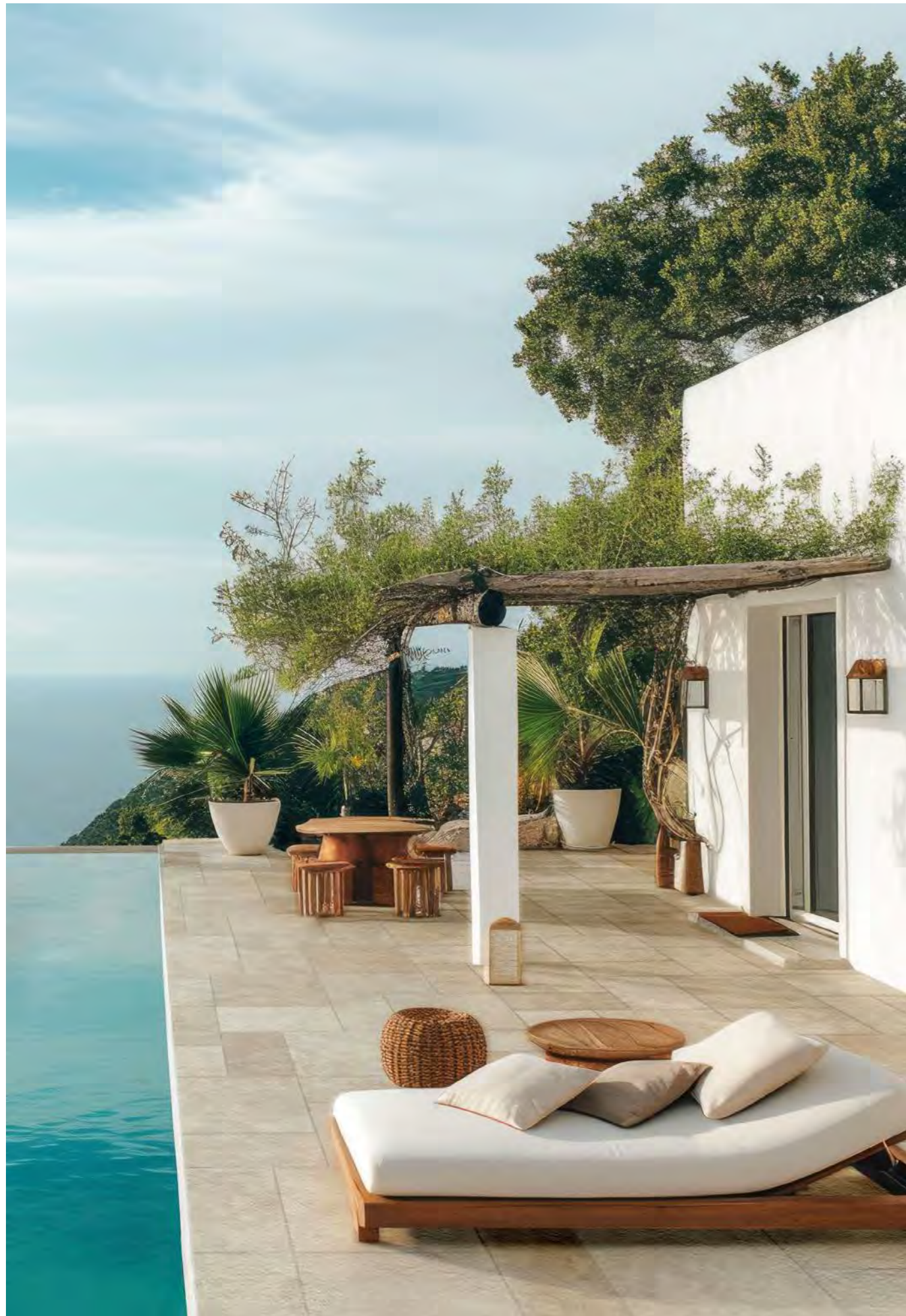
Levante Naturale 30x60-40x60-60x60 Antislip R11